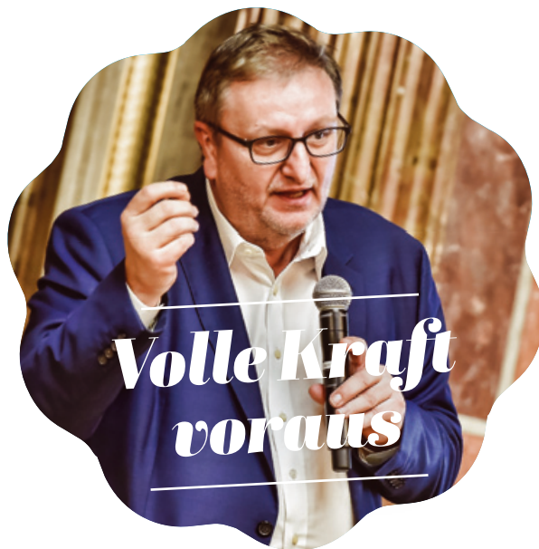
Ihr Christian Kern

Also: Worauf warten? Von uns aus kann's losgehen!